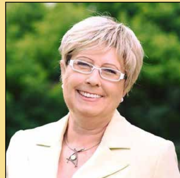
▶ Místostarostka Prahy 12 Eva Tylová