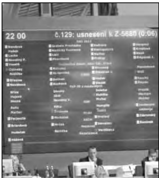
► Výsledek hlasování

Příběh Mariánského sloupu na Staroměstském náměstí se stal i příběhem ideologického symbolu obecně. Příběhem symbolu určité ideje, ideologie a jejího praktického užití v lidských skutcích. Drtivá většina ideologií, těch, které překračují rámec jedné komunity, jednoho národa, jedné společenské vrstvy, má určité, opodstatněně přitažlivé, pravdivé jádro, nese nějaké širokými vrstvami uznávané poselství. Lásku či úctu k bližnímu, respekt k osvědčeným hodnotám, volání po svobodě, touhu poznávat, touhu po spravedlnosti, vědomí sounáležitosti s okolním světem a spoluzodpovědnosti zaň... Každá z takových ideologií posunula lidstvo dál, dala a dává životní smysl mnoha lidem, kteří upřímně, poctivě dle té které ideologie rozmýšlejí a konají, obohatila mozaiku lidského charakteru dalším střípkem. Ty barevné, čisté střípky a krystaly lidskosti a lidského poznání pojí jakási tvárná, šedivá, nevábná, lepivá hmota... Čím vznešenější myšlenka, poutavější idea, tím lákavější pro zneužití, pro balamucení vyznavačů. Čím vyšší dobro hlásá, tím větší zločiny se za ni skryjí. To je i příběh Mariánského sloupu na Staroměstském náměstí. A je to příběh i mnoha dalších výtvorů vesměs čistých duší a rukou, kterých se však postupně zmocnily temné charaktery se špinavýma rukama.