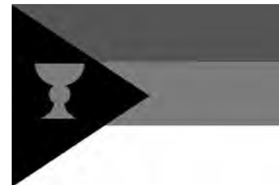
► Jeden z návrhů české vlajky