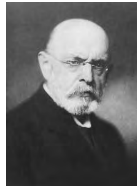
► Alois Jirásek