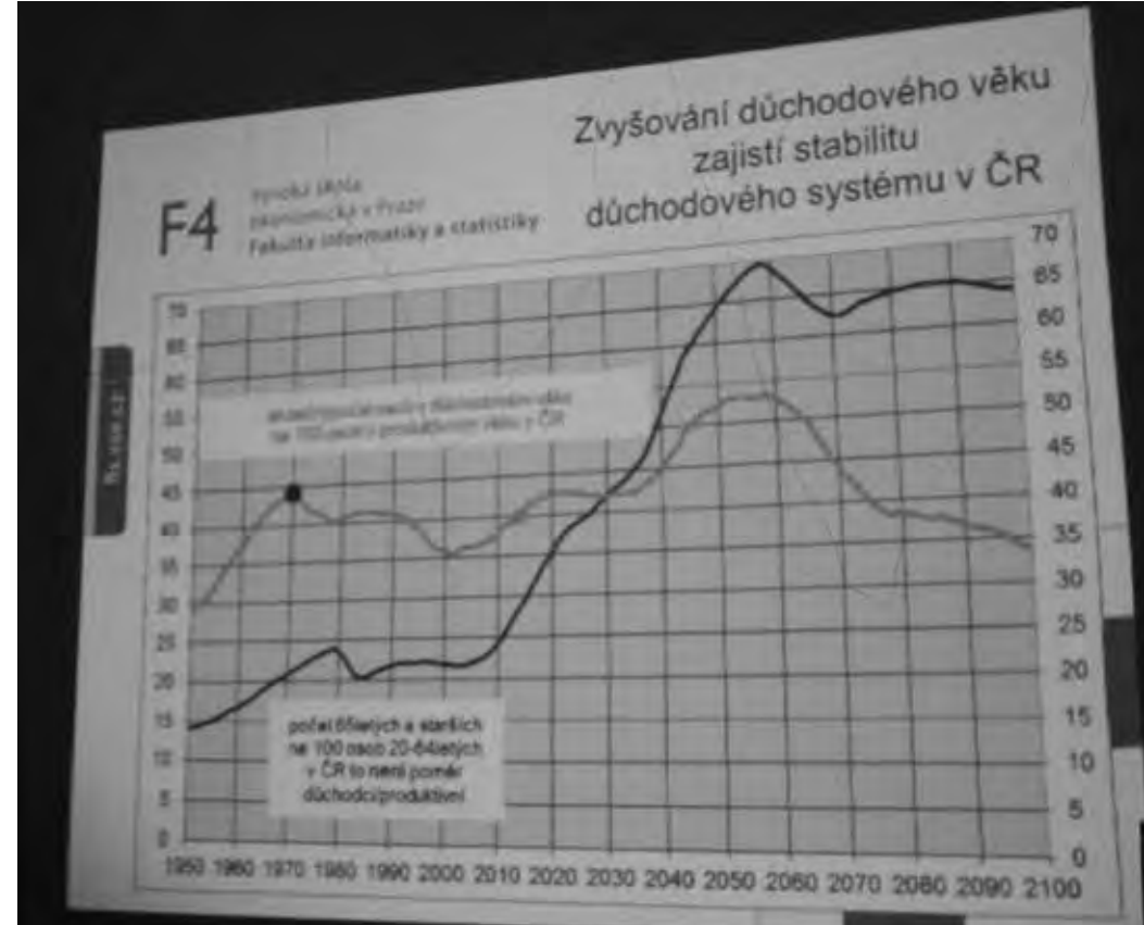
►Na obrázku vidíme rozdíl mezi tabulkovými poměry a skutečnými poměry dle reálné ekonomické aktivity

Zdůraznil také problematičnost demografických projekcí a prognóz, za ještě více nejisté ovšem pokládá předpovědi ekonomického vývoje. Dle Fialy by se do konce století mohl průměrný věk