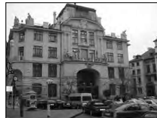
► Magistrát hl.m. Prahy