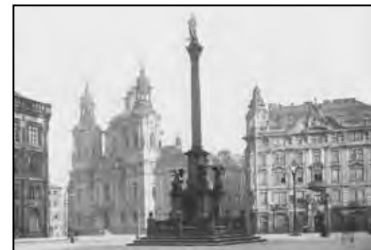
► Mariánský sloup

Odpor proti obnově Mariánského sloupu na Staroměstském náměstí není útokem na křesťanskou víru, na řadové věřící, je obranou historického poznání, poznání vzešlého z tragických osudů výrazné většiny obyvatel českých zemí. Nejen nevěřících a vyznavačů jiné víry, nýbrž i řady katolíků, kteří si uvědomili, že svoboda myšlení, politická občanská demokratická práva, suverenní ekonomický a kulturní rozvoj a sociální spravedlnost jsou více než slova, blahobyť a živobytí úzké vrstvy císařských vládců a úřadů a představitelů jejich státocírkve ideologicky vyztužující podřízení běžných občanů monarchii.