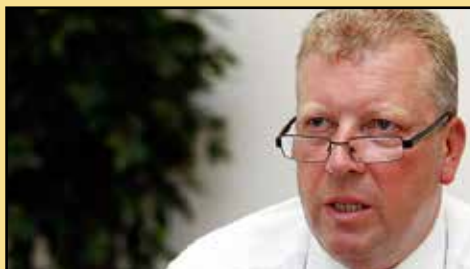
► Jiří Besser

V březnu roku 2011 navštívili historickou budovu ministři kultury a dopravy Jiří Besser a Vít