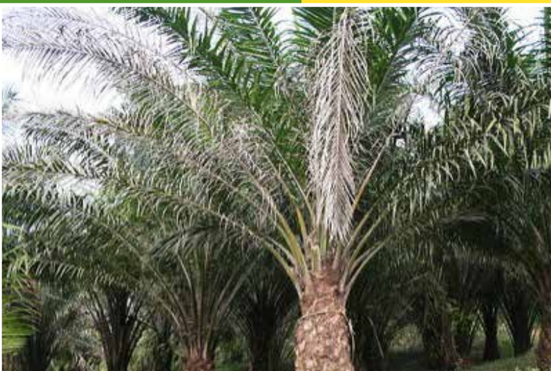
► Palma olejná