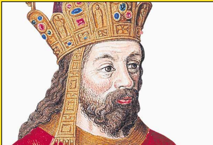
► Karel IV.

ka. Proto pravdu je nutno hledat, odkrývat a představovat v celé komplexnosti, seriózně, objektivně. Jedině tak je to skutečný statek, ne hnojiště. Pro pravdu jako statek veřejný to platí o to více, že pohledů, informací a interpretací skutečnosti je daleko více a jsou z různých stran.