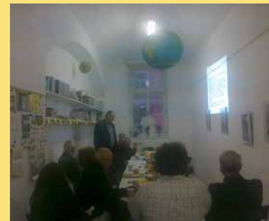
► Čaj v sídle Alternativy Zdola

Na našem webu bude k dispozici celá prezentace z únorového čaje a také se můžete těšit na videozáznam. ◀