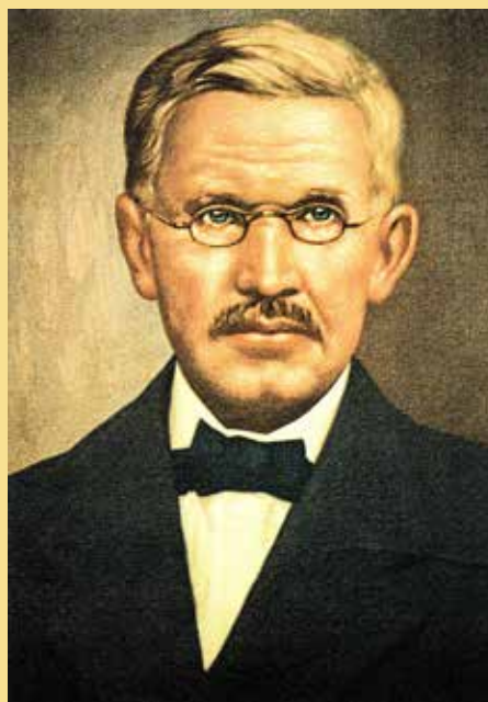
▶ Friedrich Wilhelm Raiffeisen