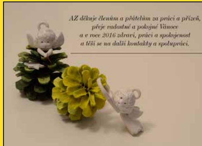
▶ PF Alternativy Zdola 2016

S tarý rok 2015 skončil a hned začal nový rok 2016. Bez sebemenší přestávky, přestávečky. Pauzičky třeba na kafe, cigárko, na to si odskočit, dokonce ani na reklamu. Nic. Takže ty problémy a úlohy roku loňského vzorným pořadovým krokem napochodovaly do letoška. Bez výjimky. Nadále se tudíž budeme v AZetku věnovat participativnímu rozpočtu a vůbec spoluúčasti občanů a zaměstnanců na řízení veřejné a firemní sféry, družstevnictví, místním hospodářským koloběhům, smlouvě TTIP, otevřenosti a kontrole veřejné správy, zodpovědnosti za věci veřejné, spravedlnosti a solidaritě ve společnosti, zachování míru a životního prostředí. Některé z úloh jsou hlavní a máme v nich již solidnější, respektovanou pozici, jiné jsou mnohdy společenský významnější, ale naše síly stačí jen na podporu jiných, silnějších subjektů při jejich řešení. Určitě nestíháme všechno udělat, bude to ze spektra společenských problémů jen zlomeček, ale vše, či skoro vše, či spíše vše důležité, bychom se měli snažit sledovat, abychom znali kontext, abychom v daném komplexu struktur a vztahů rozhodovali se co nejefektivnějším výsledkem.