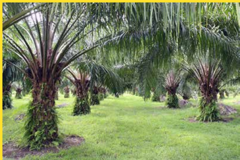
► Palma olejná

v EU informování na obalech výrobků o typu tuků, které obsahuje (zatím bez procentuálního množství). Společnost pro výživu doporučuje především více střídmosti při výživě, dále upřednostňovat tuky s nízkým podílem nasycených mastných kyselin a trans-mastných kyselin, s vyšším obsahem esenciálních PUFA omega 3. Tomu rozhodně neodpovídá složení palmového či palmojádrového tuku, které jsou