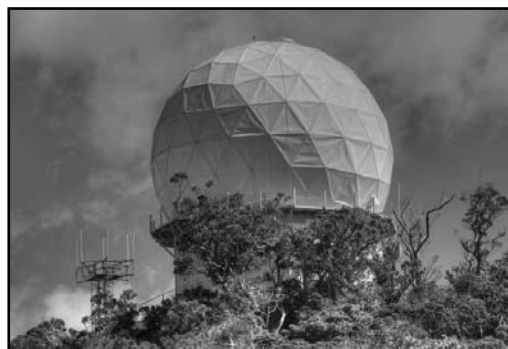
► Americký radar na Havaji

nou po nějakém třaskavém tématu, které nadhání hlasy. Všechny Čechy ozbrojit! Nepodlehnout hrozbě (letos dvanácti) uprchlíků! Pozor na ty, komu se daří, mohli by nás zastínit! Hlavně žádné nové členy, narušili by pořadí na funke.