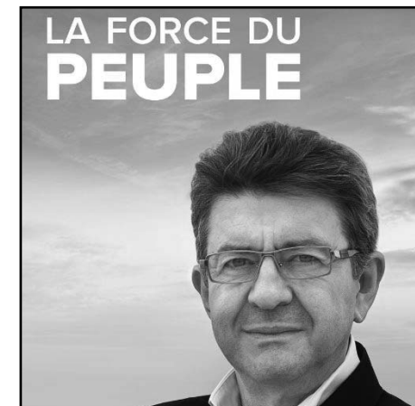
► Jean-Luc Mélenchon

Nepomůžou nám s tím staří politici, kteří to vytvořili. Prvním úkolem tedy je hledat nové lidi, kteří to chtějí a mohou dělat. I lidi z občanských a ekologických iniciativ, kteří se zatím zabývali některou z dílčích složek takového problému. Teď potřebujeme integrátora, který to dokáže zasadit do velkého celku. Dělat něco jiného je skoro zabíjení času. ◀