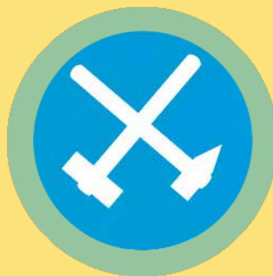
► Logo Ende Gelände

V květnu 2016 došlo v rámci akce Break Free (from Fossil fuels) k aktům občanské neposlušnosti, na kterých participovalo více než 30 tisíc osob v Evropě a na dalších místech celého světa (např. Brazílie, Indonésie, Nigérie, Nový Zéland, USA). V německé Lužici po předem nahlášené masové blokádě tisícovky aktivistů za klimatickou spravedlnost jako součást hnutí Ende Gelände vnikly do de facto prázdného povrchového dolu a zablokovaly na více než 48 hodin činnost důlní techniky a trať, kterou se převážívá hnědé uhlí do elektrárny. Aktivisté chtěli dát jasně a veřejně najevo svůj názor, že uhlí musí zůstat v zemi – Keep it in the ground! A to i za cenu rizika zadržení či zatčení policií. Toto stanovisko podporují i vědecké výzkumy – C. Mc Glade z londýnského UCL Institu-