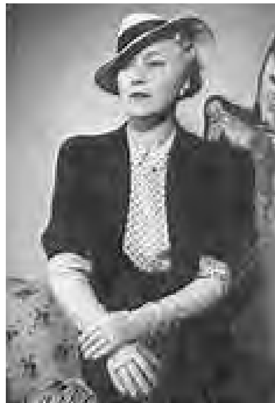
► Olga Scheinpflugová