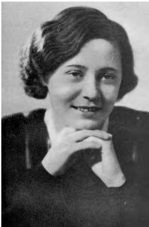
► Vítězslava Kaprálová