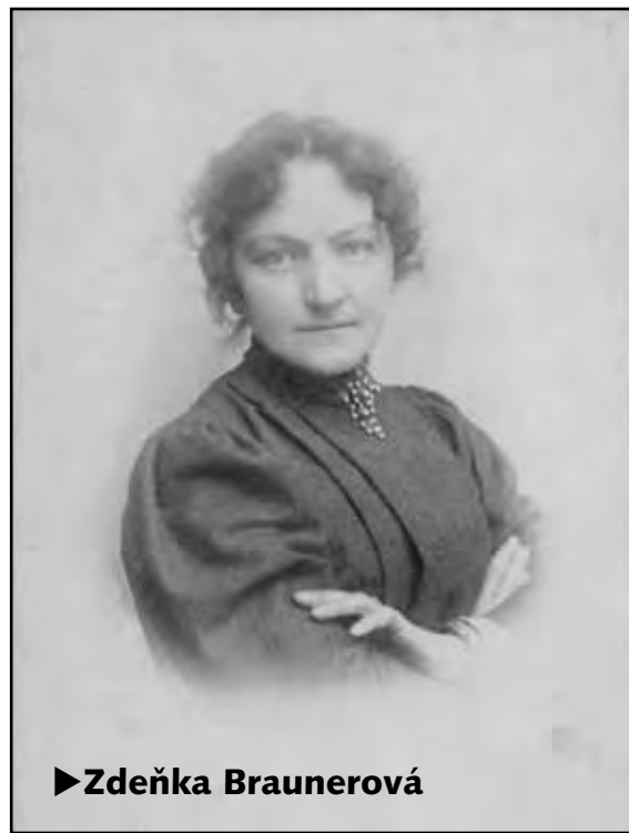
► Zdeňka Braunerová

Patří bezesporu k významným osobnostem první třetiny 20. století. Její význam si v pravém slova smyslu uvědomíme, když se podíváme na společenskou situaci druhé poloviny 19. století – doby, ve které Zdeňka