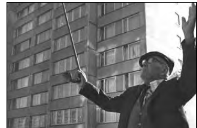
► Z filmu Panelstory (Režie V. Chytilová, 1979)

Situace po 30 letech volného trhu nespoutané blbosti a gaunerství v bytové politice má následující kontury. Rozdíl v cenách bytů v rámci republiky dosahuje řádové úrovně, kdy za sumu, za níž pořídíte běžný byt v Praze,