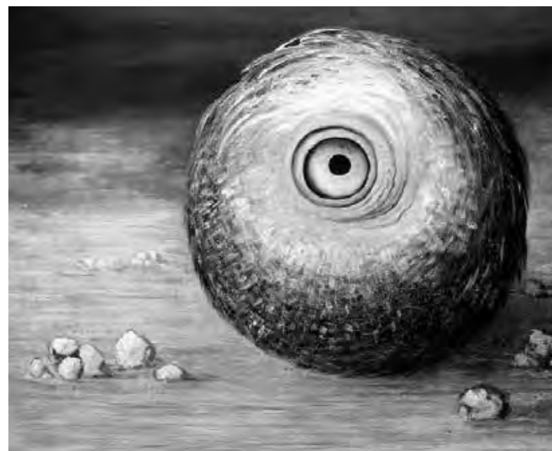
► Dílo s názvem „Fantom“ od Toyen

Další osobností, které se podařilo prolomit ledy mužského světa, se stala malířka, grafička Toyen , /1902 -1980/, kterou bychom mohli jedním slovem charakterizovat jako věčně tajemnou. Víme, že je to právě tajemství, které tak často přitahuje k umění, právě to tajemství, funguje často jako výzva k divákovi, či posluchači. Vyzývá jej, aby hledal, v uměleckém díle odpovědi na své otázky. Právě ta tajemnost je tak charakteristická pro tvorbu, ale i životní cestu Toyen, vlastním jménem Marie Čermínové. Toyen bývá řazena k avantgardě, k surrealismu a spolu s Jindřichem Štýrským, je představitelkou jedinečného výtvarného směru, který nazvali artificialismem. Stručně bychom jej mohli charakterizovat jako jistý abstraktní projev, svým způsobem ovlivněný surrealismem. Toyen se spolu se Štýrským profilu-