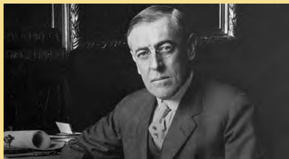
► Woodrow Wilson

čem k řešení poválečného uspořádání Evropy, mj. že ČSR a spojení slovanských zemí přispěje k zadržení pangermanské expanze (i na britský Blízký východ). Projekt ČSR, jak politolog pokračoval, vyhovoval nové velmocenské rovnováze, kdy Francie chtěla v týlu Německa spolehlivého partnera, Britové chtěli zabránit spojení Německa a Ruska a jejich ovlád-