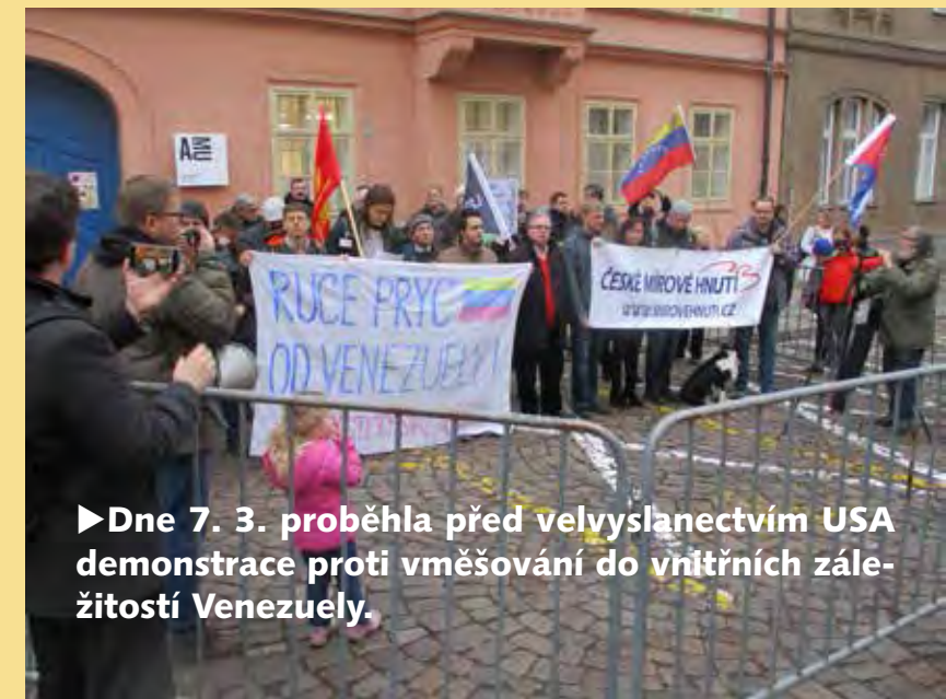
► Dne 7. 3. proběhla před velvyslanectvím USA demonstrace proti vměšování do vnitřních záležitostí Venezuely.

lismu 21. století v r. 2005. Kalenda též podtrhl ideologickou pružnost chávismu a poukázal na někdejší vlnu levicových vlád v Jižní Americe. Buben dále popsal ale i následující postupné, „salámové“ odpadávání sympatizantů od chávezistů (komunistů, části vojáků, části středních vrstev atd.) podle toho, jak se vyvíjela jejich politika a reálné kroky představitelů státu. Upozornili mj. na možné vazby volebního chování občanů s distribucí potravin a jinými opatřeními veřejné správy, protože pro volby jsou užívány elektronické osobní doklady. Když se to doplní o vyloučení některých oponentů z kandidátek, během posledních let