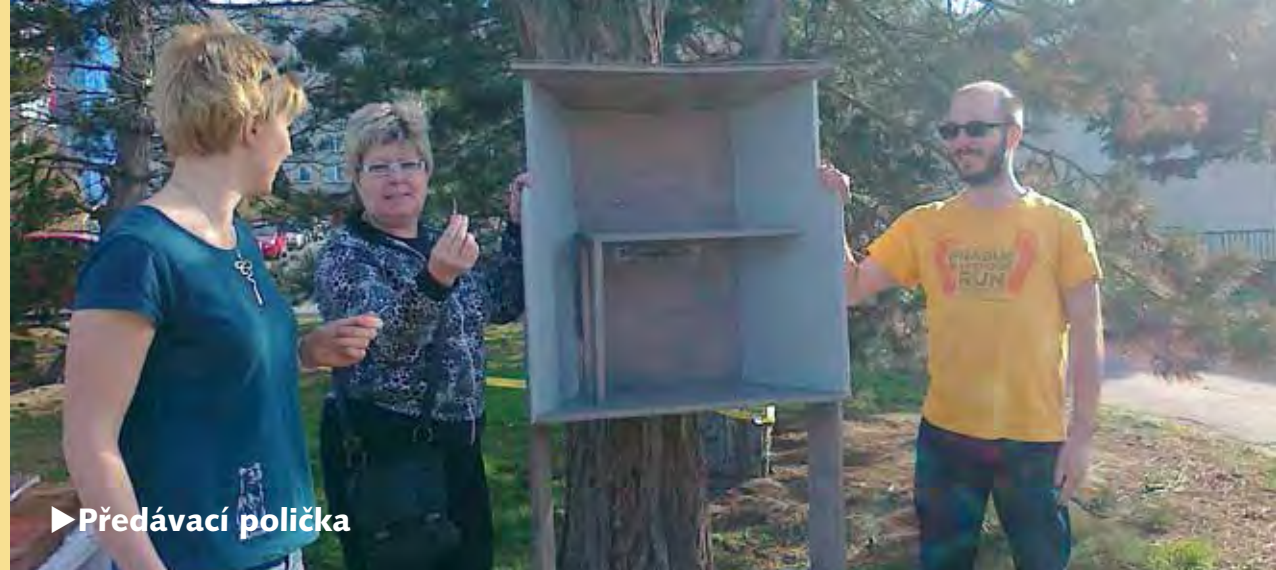
► Předávací polička

Druhý příklad se týká naší předávací modřanské poličky. Je to možná trošku zvláštní psát o poličce, kam občané dávají věci, které již nepotřebují, zatímco ti druzí si je berou. Ale u nás se „aféra s poličkou“ stala příležitostí pro oživení komunitního spoluzití. Polička fungovala dobře více než rok, byla také skvěle umístěna přímo na cestě k místnímu „náměstíčku“ se supermarketem, na cestě ze zastávky tramvaje, vedle je škola. Na sídlišti žije mnoho sociálně slabších spoluobčanů, ale najdeme tu i hodně lidí bez domova. „Obrat“ na poličce byl enormní, kolikrát se mi stalo, že jsem do ní něco