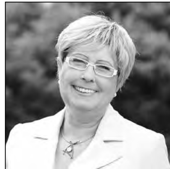
▶ Místostarostka Prahy 12 Eva Tylová