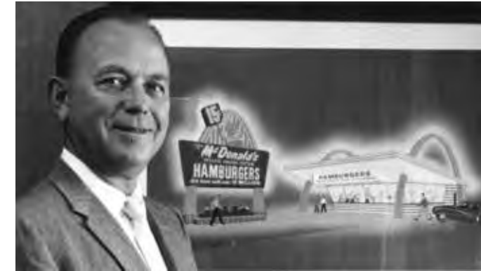
► Raymond A. Kroc (1902 – 1984)