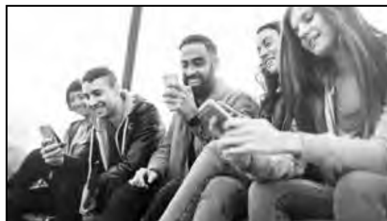
► Generace mileniálů