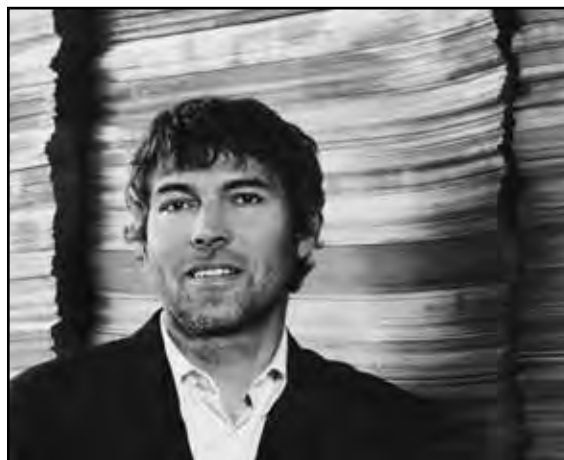
► Petr Kellner