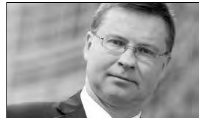
► Valdis Dombrovskis

Konkrétní přípravy Evropského akčního plánu pro zaměstnanecké vlastnictví akcií popíší nakonec vi-