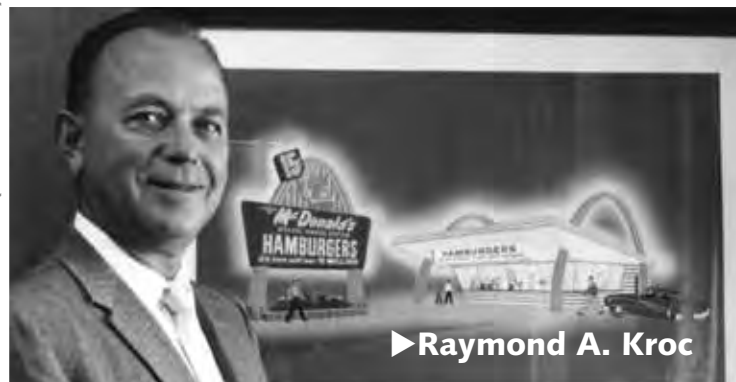
▶Raymond A. Kroc

Kdo dnes ze stamilionů Američanů stravující se v restauracích Mc Donald's, jen trochu tuší, že za hamburgerem je úspěch syna českého vystěhovalce, hostinského ze Stupna...?◀