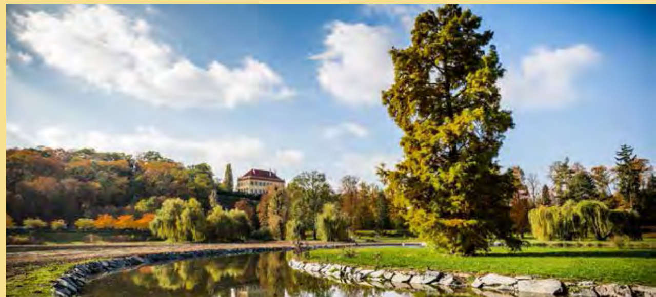
► Park Stromovka

jiny. Údajně bylo sjednoceno odborné názvosloví. Propojení zákonů ale předpokládá vzájemné předání konkrétních požadavků – v našem případě jde o předání podkladů pro ochranu urbanistických hodnot z památkového zákona do zákona o územním plánování. Stávající památkový zákon předává pouze seznam kulturních památek. Chybí ale ochrana zbylé mnohem početnější neregistrované zástavby, která může památky podpořit nebo zničit. Chybí předání urbanistických hodnot této zástavby, které památkový zákon ani nezná. Dokud nebude tento nedostatek odstraněn, budeme bourat