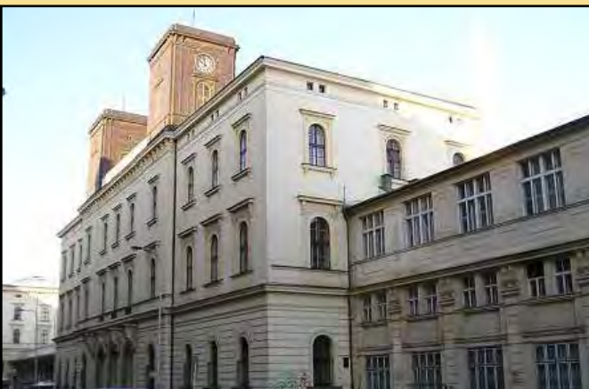
► Masarykovo nádraží

DISKUZE ZE DNE 27. 11. 2018 – STRUČNÝ ZÁZNAM