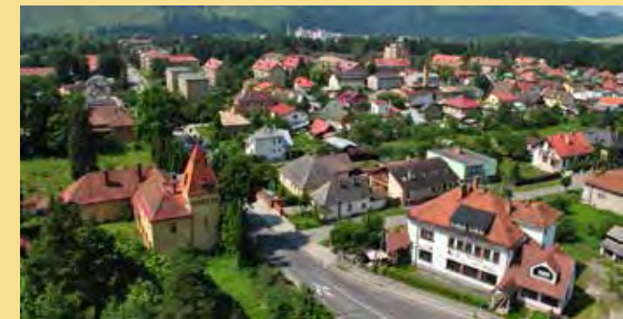
► Liptovský Hrádok

Oproti mnohým kandidujúcim som väčšiu kampanď robil ja, s volebnou kalkulačkou na FB, priamym oslovovaním na ulici (získavanie podkladových otázok a snaha nadviazať spoluprácu), s krátkou prezentáciou v dvoch triedach na miestnom gymnáziu a roznesením letáčku/vizitky o vytvorenej volebnej kalkulačke po celom LH.