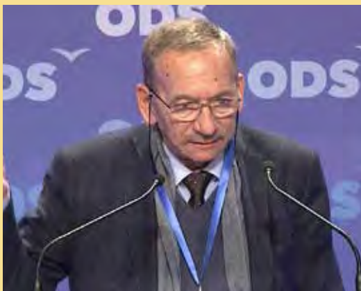
► Jaroslav Kubera