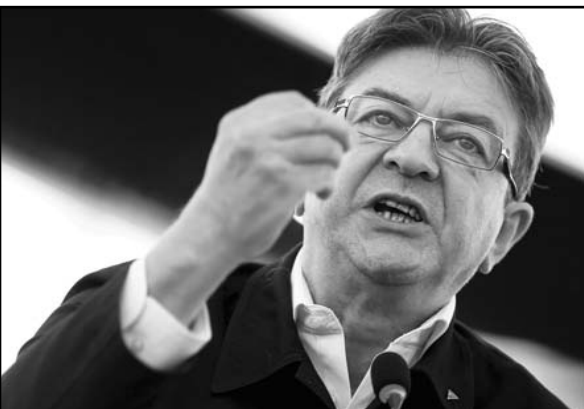
► Jean-Luc Mélenchon