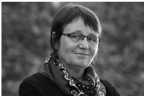
► Anna Šabatová

http://casopisargument.cz/2017/06/27/kvoty-jou-ek-hloupy-napad-ze-musi-chapat-macron-s-merkelovou-i-oskar-krejci/