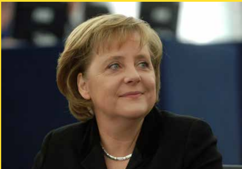
► Angela Merkelová

Ta střecha je na konci slepé uličky. Vedla k ní dlouhá cesta a ještě mnohem delší odysseou bude cesta zpět. Řečtí voliči si desetiletí koho si volili ve volbách, které nikdo nenapadal, za svoji volbu tudíž musejí nést plnou zodpovědnost. Je a bude krutá, ale když si následky svých hlasování voliči neuvědomují rozumem, tak snad si je uvědomí životní praxí. Situace Řeků je o to těžší, že ti, jež se pasovali do pozice partnerů, přátel, kteří jim pomohou, tak jsou fakticky predátoři, pomáhající, leč do ještě hlubší bíd.