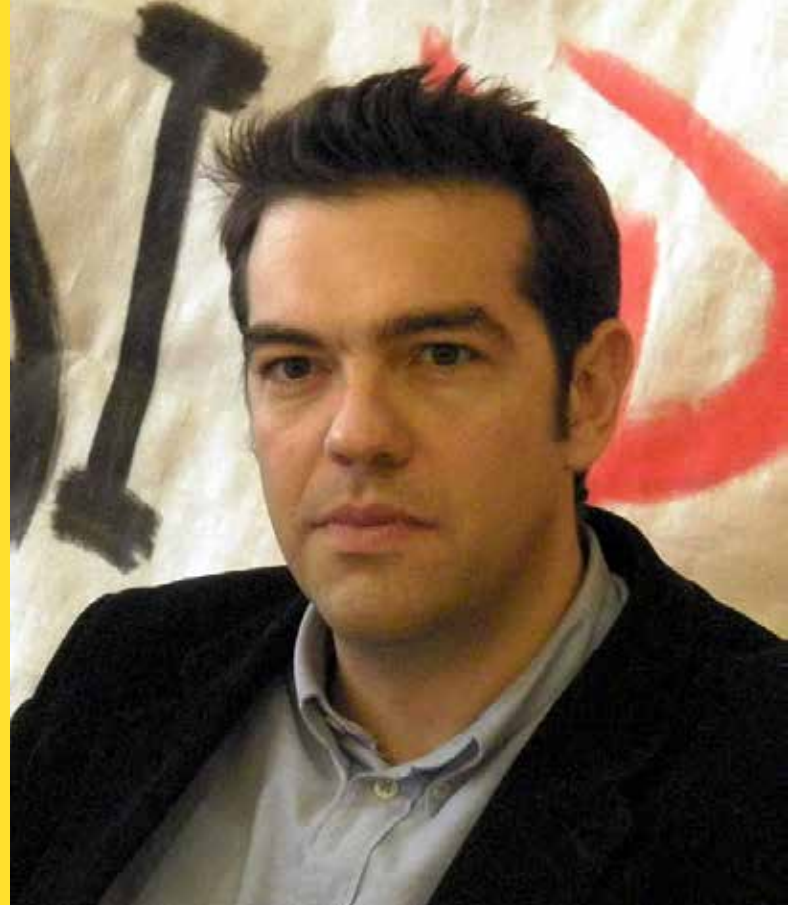
► Alexis Tsipras

a zásobujících tuzemské obyvatelstvo, firmy a veřejnou správu základními potřebami a službami. Jaký podíl na trhu musí tato skupina obsluhovat, je u různého zboží a služeb různé, dle rizik, které by výpadek produkce soukromých firem mohl způsobit. V některých oborech musí být tato kostra páteří (energetika, voda apod.), někde jen nouzovou kostí pro případ ochabnutí soukromých svalů. Rozhodně ovšem nestačí tradiční pojetí státních podniků – tuneláři a korupčníci ukazují slabiny dosavadního způsobu řízení společných podniků. Veřejná správa a zaměstnanci musejí mít dostatečný vhled do jejich řízení, kontrolu či podíl na řízení, aby minimalizovali riziko zlovůle a chyby manažerů. Zdali to bude družstvo nebo akciovka a jaký bude mít kdo – stát, samospráva, zaměstnanci – akciový podíl, to je na konkrétních podmínkách. Zatímco fabrika na válečné zbraně nesmí podléhat žádnému ziskuchtivému faktoru, tj. vyloučena je i účast zaměstnanců a případný podíl místní samosprávy by mohl být jen na úrovni zabránění ekologických rizik, u výroby ponožek, kapesníků apod. je nutno zajistit zásah státu jen v krizových okamžicích. Někde musí mít větší vliv krajská samospráva, jinde místní, někdy mohou mít větší slovo zaměstnanci, jindy veřejná správa a určitě není apriorně vyloučena ani účast soukromých subjektů jako minoritních podílníků, spoluinvestorů apod. Vztah popsané struktury k soukromému sektoru by ostatně byl velmi citlivým místem, ale obsazení části tržního prostoru je vyváže-