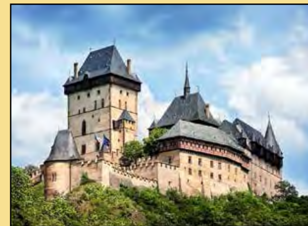
► Hrad Karlštejn

Československo zanechalo v dějinách 20. století nepřehlédnutelnou stopu. Nová republika nebyla jen naplněním národních ambicí, nýbrž i demokratických tužeb a stala se ostrovem demokracie uprostřed středoevropského moře režimů autoritativních. Tragédie Mnichova vstoupila do dějin světové politiky. O sblížení ekonomické a sociální úrovně českých zemí a socialisticky industrializovaného Slovenska si mohou západní Němci, kteří si „koupili“ východní Německo, jen zdát. Označení „Made in Czechoslovakia“ ani po 29 letech nebylo překryto značkou „Czech made“ - tu mladší totiž není moc kam dávat. Lepit je na subdodávky, podsestavy, jednotlivé díly? Na rozdíl od dřívějších investičních celků, tisíců tramvají, lokomotiv, nákladáků, motorek, obráběcích a textilních strojů atd. Co ostatně čekat od vazalské země, od satrapů v jejím čele, od podnikavců, tunelářů, ziskuchtivců, korupčníků, egoistických kořistníků bez rozhledu, bez hlubšího duchovního vědomí, bez vyšších ideových ambic, jež ale zemi udávají tón. Žijí aktuálním okamžikem,