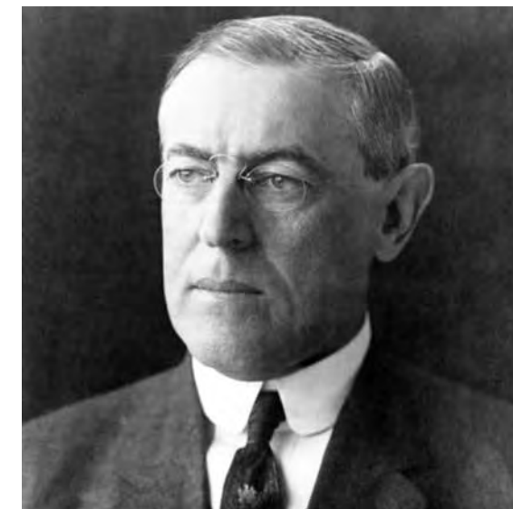
► Woodrow Wilson