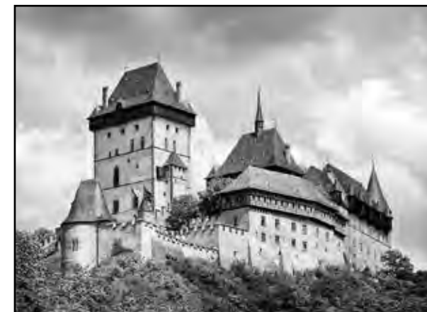
► Hrad Karlštejn