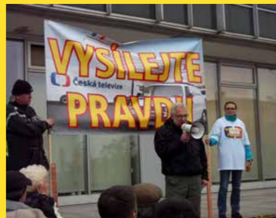
► Režisér Václav Dvořák na demonstraci