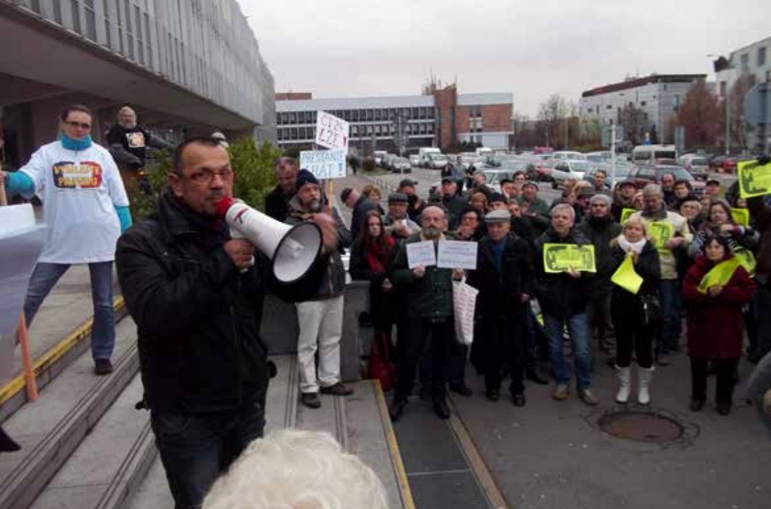
► Poslanec Jaroslav Foldyna na demonstraci před Českou televizí „Vysílejte pravdu“