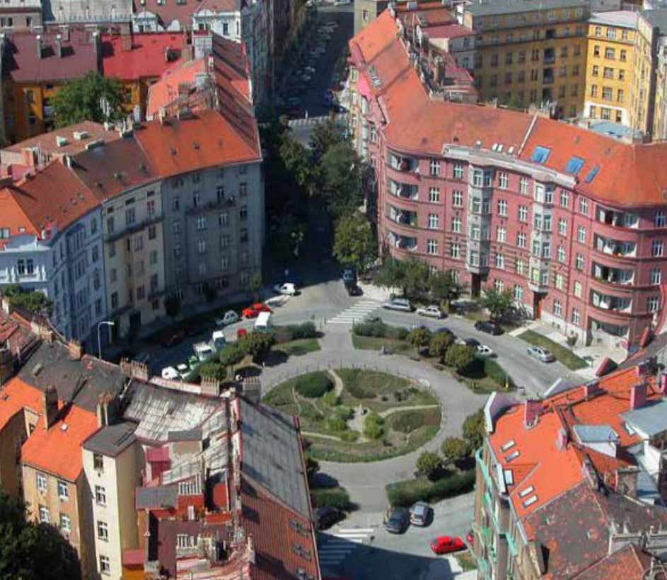
►Škroupovo náměstí v Praze

že období, které prožíváme je : „...náročné na naši psychiku, hodně z nás má i veliké ekonomické starosti. Je těžké najít energii a pokoušet se něco měnit. Ale pokud se k tomu neodhodláme, kdo jiný? Nikdo jiný tu není. Jen my. Tak pojďme a zkusme to aspoň. Společně. ... Přivíme tedy k jednomu stolu a pod jednu lampu všechny zklamané a ponížené, dodejme jim odvalu a překonejme společně tu zlou hodinu mezi psem a vlkem.“ (Zvýraznění v textu V.H.)