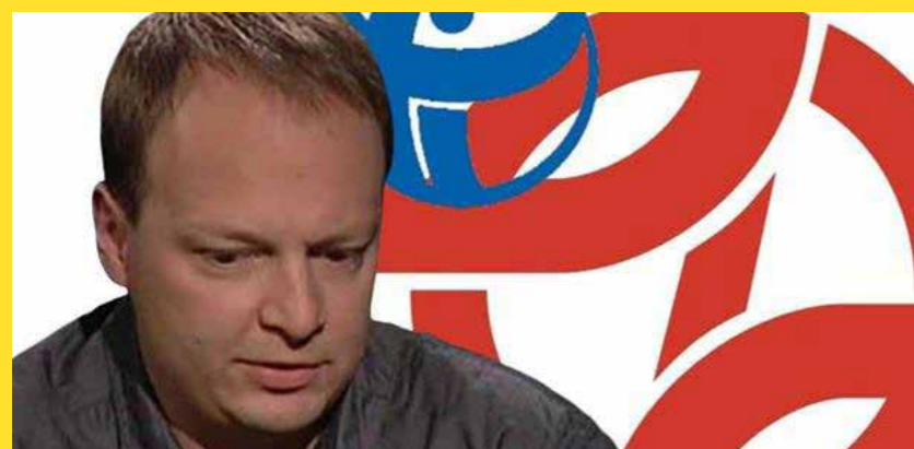
►senátor Václav Láska

Takto zdánlivě jednoduše motivovaný, ve skutečnosti promyšleně zvolený systém a přístup k výkonu funkce zahrnuje kromě