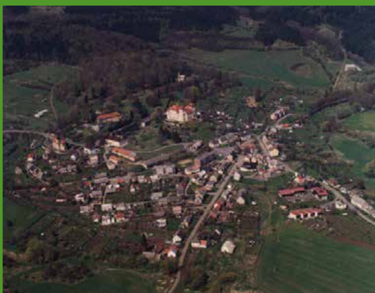
►Letecký pohled na obec Valeč

Oba hosté posloužili svými bohatými zkušenostmi nejen z Mástovic, Borovan, Prahy, Děčína a odjinud. Museli obdivovat místní obecní zpravodaj – obecní ovšem ne proto, že by jej vydávala obec,