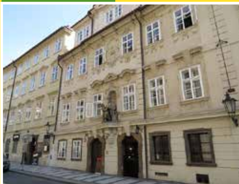
► ulice Tomášská v Praze