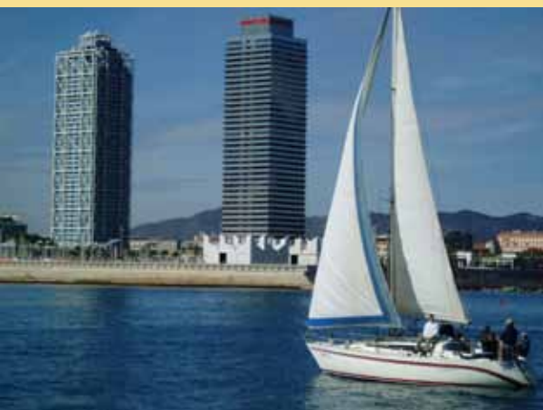
► Snímek z Barcelony

Vhodný příklad nabízí katalánská Barcelona. Můžeme tam sledovat konkrétní postupy, jak využít energii protestního hnutí a transformovat je na politic-