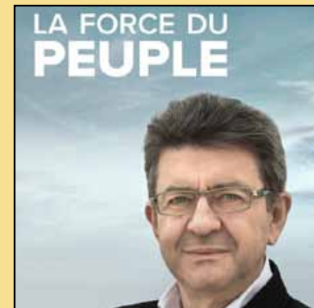
► Jean-Luc Mélenchon

Nepomůžou nám s tím staří politici, kteří to vytvořili. Prvním úkolem tedy je hledat nové lidi, kteří to chtějí a mohou dělat. I lidi z občanských a ekologických iniciativ, kteří se zatím zabývali některou z dílčích složek takového problému. Teď potřebujeme integrátora, který to dokáže zasadit do velkého celku. Dělat něco jiného je skoro zabíjení času. ◀ (zf)