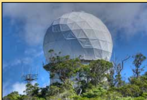
► Americký radar na Havaji

nou po nějakém třaskavém tématu, které nadhání hlasy. Všechny Čechy ozbrojit! Nepodlehnout hrozbě (letos dvanácti) uprchlíků! Pozor na ty, komu se daří, mohli by nás zastínit! Hlavně žádné nové členy, narušili by pořadí na funke.