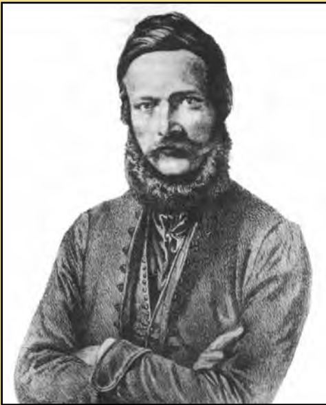
► Ľudovít Štúr

zení. Prvním impulsem byly – podobně jako v českých zemích – reformy císaře Josefa II. Během 1. etapy, od konce 18. stol. do r. 1820, se vzdělaní Slováci snažili o kodifikaci slovenského jazyka. Významnou skupinou této doby byli „Bernolákovci“, sdružení kolem katolického kněze Antona Bernoláka. Ti zastávali názor, že by slovenštinou mohl být jazyk vycházející ze západoslovenského nářečí. V další fázi, do r. 1830, došlo k opravdovému „probuzení“ Slováků. Vznikly další dva proudy. První proud tvořila skupina zastánců poslovenštěné češtiny, které se do čela postavili Jan Kollár (1793 – 1852) a Pavel Josef Šafařík (1795 – 1861). J. Kollár, autor knihy sonetů Slávy dcera, po ukončení studií přijal roku 1819 úřad evangelického duchovního v Pešti (východní část Budapešti), kde s přestávkami působil třicet let. V roce 1834 se stal prvním předsedou Spolku milovníků slovenské řeči a literatury. P. J. Šafařík zásluhou Františka Palackého vypomáhal při redakčních pracích v časopisu českého Národního musea a po odstoupení Palackého časopis redigoval. V letech 1834–1835 byl redaktorem časopisu Světozor a od r. 1848 byl ředitelem pražské Univerzitní knihovny.