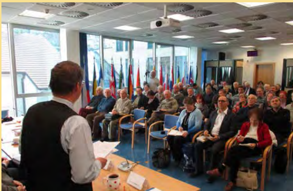
► Foto z konference