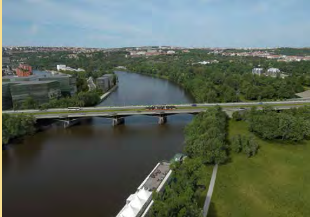
► Libeňský most

Ziskuchtivost developerů je kapitalismu vlastní, je jeho motorem a pohání podnikatele, ať vzdělání vysokoškolského či jen základního, ke kořistění bez ohledu na lidi, přírodu, kulturu. Lidi se snad ozvou, příroda se s tím vyrovná, někdy i pomstí, za kulturu se musejí postavit lidé. Kulturní. Pokud se nějaká najdou.