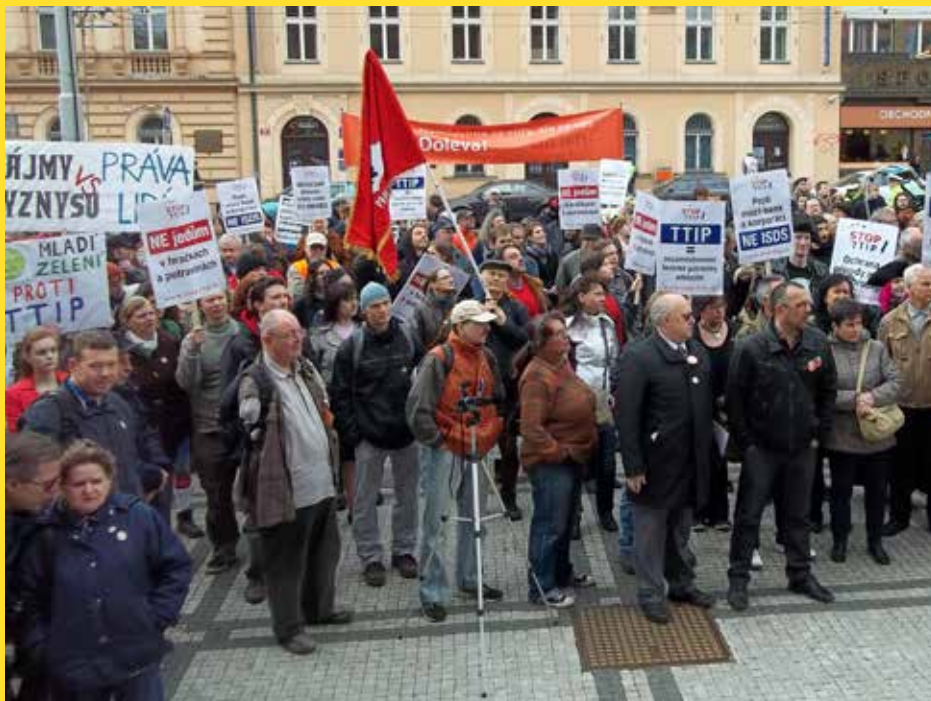
► Na demonstraci proti TTIP

N ejen již tradiční triáda nebezpečí, která může přinést utajeně vyjednávaná smlouva o transatlantickém obchodním a investičním partnerství mezi USA a EU – ohrožení potravinářských, zemědělských a ekologických standardů, zánik pracovních míst a omezení práv zaměstnanců a arbitrážní doložka ISDS –, ale i zprávy o kritickém postoji komisi a výborů EP ke smlouvě, odsouzení kapitalismu a úvahy a výzvy o dalším pokračování boje proti smlouvě zaznívaly na demonstraci proti TTIP, která se uskutečnila 18. dubna v Praze na nám. 14. října v rámci mezinárodní Dne proti TTIP. Na Smíchov dorazilo přes 350 lidí, přičemž asi padesátku tvořili aktivisté neformálního žižkovského komunitního centra Klinika, z velké části příznivci anarchistických sdružení, kteří se také postarali o hudební složku následujícího průvodu na Palachovo náměstí.