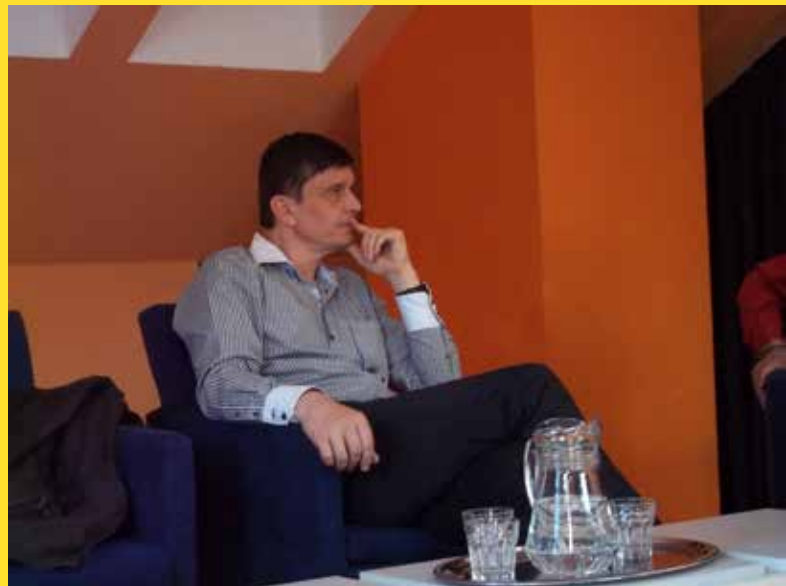
► Starosta Prahy 5 Radek Klíma