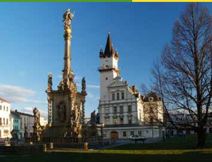
► Moravský sloup a radnice v Uničově

► Rozklikávací rozpočet Uničov: http://rozpocet.unicov.cz/