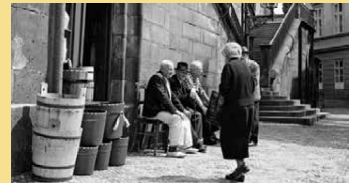
► Z výstavy „Chudá Praha“