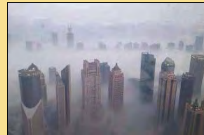
► Smogová situace v mnoha městech je kritická