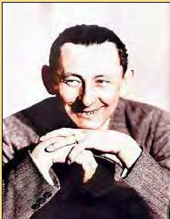
► Vlasta Burian

Dnes bychom jej asi titulovali: bavič, ale také herec, principál, sportovec, imitátor. Jeho popularita v období První republiky byla nepřekonatelná. O jeho komediálním talentu se můžeme přesvědčit díky řadě filmů dodnes, i když ti, kteří jej zažili na scéně, tvrdí, že se to nedá srovnat. Zamyšlení nad úlohou Vlasty Buriana v kontextu naší kultury staví před nás problém kultury v Protektorátu, chování řady protagonistů v této komplikované době. Tato otázka je velmi citlivá, bude jistě potřebné se k ní vrátit, když se budeme zamýšlet právě nad obdobím poznamenaným druhou světovou válkou. Každopádně není lehké a teď máme především na mysli interpretační umělce, stavět jednoznačně proti sobě různé osobnosti. Vzpomeňme například Václava Talicha, Natašu Gollovou, Annu Letenskou, Karla Högra, Vl. Vančuru, Karla Hašlera a tedy také Vlastu Buriana. ◀