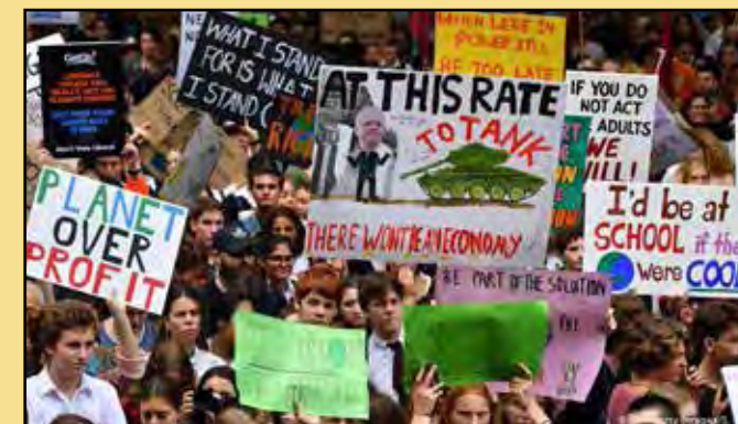
► Z demonstrace Fridays for Future

Děti, opilci a blázni říkají pravdu, traduje se po generace. Dětské lži jsou prvoplánové, mladí sice nějaký osobní podfuk občas udělají, ale obecně, ve společenském životě se ještě v „rychlošípovém“ rozhořčení jasně staví proti nespravedlnosti, lžím, podvodům, intrikám. Po formální zkoušce dospělosti pak přichází zkouška skutečná, nejen intelektuální, ale i morální, celoživotně morální: jak se vyrovnávat se poznáním, že dospělácký svět je plný neupřímnosti. Ostatně určujícím rysem kapitalismu jako jednoho z vykořisťovatelských systémů, jímž se odlišuje od otrokářství a feudalismu, je podvod, kterým vykořis-