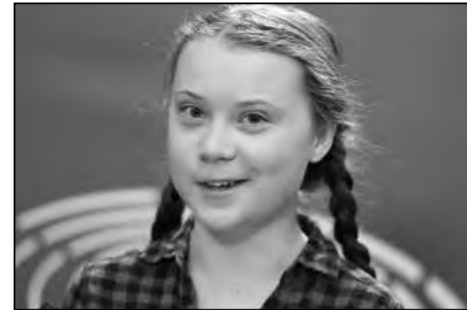
► Greta Thunbergová

To je totiž evidentní. Před 50 lety se začalo hovořit o nezbytnosti vysadit okolo Sahary 10 až 20 km široký pás lesů, aby se zastavilo její šíření na jih. Stojí? Nestojí. Poušť postoupila o sta kilometrů na jih, z Čadského jezera se stala bahňitá louže, s pískem postupuje hlad a bída. Stejně dlouho znějí varování před zánikem řady živočišných dru-