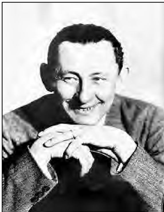
► Vlasta Burian

Dnes bychom jej asi titulovali: bavič, ale také herec, principál, sportovec, imitátor. Jeho popularita v období První republiky byla nepřekonatelná. O jeho komediálním talentu se můžeme přesvědčit díky řadě filmů dodnes, i když ti, kteří jej zažili na scéně, tvrdí, že se to nedá srovnat. Zamyšlení nad úlohou Vlasty Buriana v kontextu naší kultury staví před nás problém kultury v Protektorátu, chování řady protagonistů v této komplikované době. Tato otázka je velmi citlivá, bude jistě potřebné se k ní vrátit, když se budeme zamýšlet právě nad obdobím poznamenaným druhou světovou válkou. Každopádně není lehké a teď máme především na mysli interpretační umělce, stavět jednoznačně proti sobě různé osobnosti. Vzpomeňme například Václava Talicha, Natašu Gollovou, Annu Letenskou, Karla Högra, Vl. Vančuru, Karla Hašlera a tedy také Vlastu Buriana. ◀