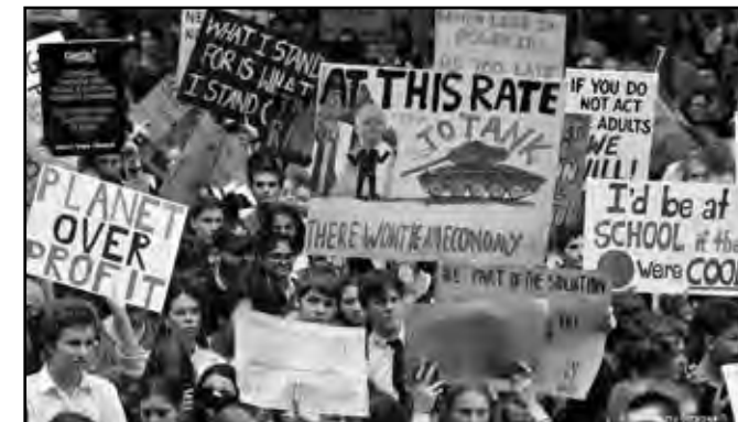
► Z demonstrace Fridays for Future

Děti, opilci a blázni říkají pravdu, traduje se po generace. Dětské lži jsou prvoplánové, mladí sice nějaký osobní podfuk občas udělají, ale obecně, ve společenském životě se ještě v „rychlošípovém“ rozhořčení jasně staví proti nespravedlnosti, lžím, podvodům, intrikám. Po formální zkoušce dospělosti pak přichází zkouška skutečná, nejen intelektuální, ale i morální, celoživotně morální: jak se vyrovnávat se poznáním, že dospělácký svět je plný neupřímnosti. Ostatně určujícím rysem kapitalismu jako jednoho z vykořisťovatelských systémů, jímž se odlišuje od otrokářství a feudalismu, je podvod, kterým vykořis-