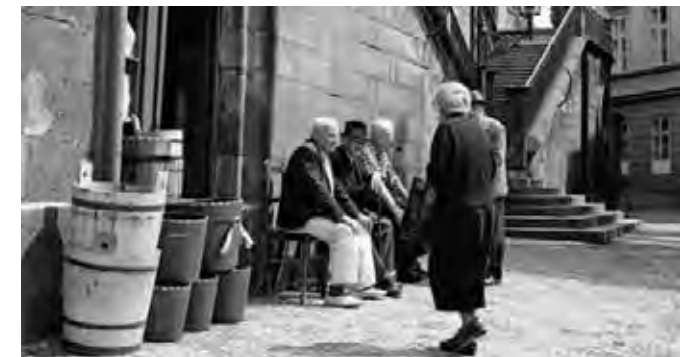
► Z výstavy „Chudá Praha“