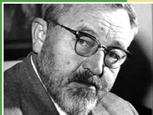
► Jan Werich