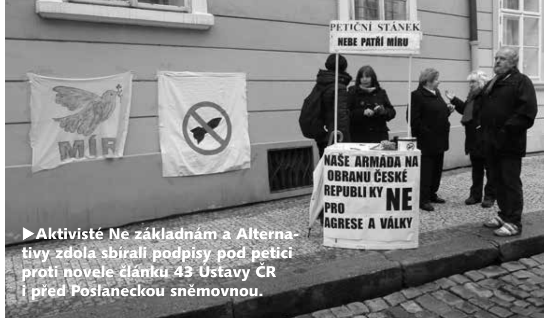
► Aktivisté Ne základnám a Alternativy zdola sbírali podpisy pod petici proti novele článku 43 Ústavy ČR i před Poslaneckou sněmovnou.