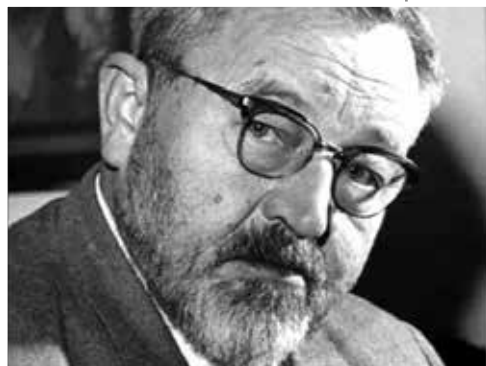
► Jan Werich