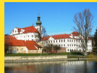
► Břevnovský klášter

„Kdo jsem? Jen bezvýznamný zatrpklý pária, ten druhý přebírá vítězství, pocty, ceny mé já je nevíra, půlkacíř, určený úprkem před citem, před láskou, před pohodlím. Ještě se někdy modlím v tom příliš hlasitém, hrabivém očištění. Co zbývá moji páni? Pokorně přečíst si tiše a bez reptání rozsudek mlčení. A nad skleničkou rakii, dál věřit na zázraky. Uctívost, vážení.“ ( http://www.youtube.com/watch?v=LHVzV2sRQtg )