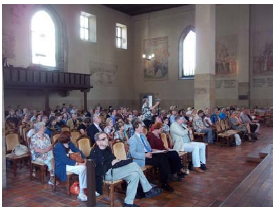
► Konference o Janu Husovi z Betlémské kaple