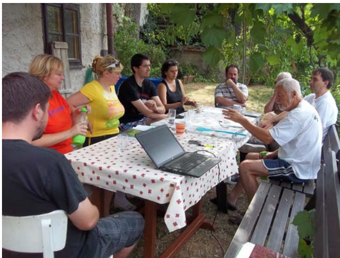
► Z letního kempu Alternativy Zdola